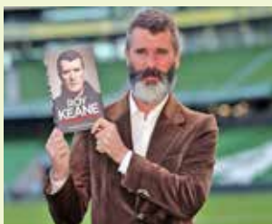
روی کین: زیادی به آرسنال اعتبار داده‌ام

روی کین و ایان رایت، دو اسطوره فوتبال انگلیس، در یک برنامه تلویزیونی به تحلیل شانس قهرمانی آرسنال پرداخته‌اند. در این بحث داغ که گری نویسل و جیمی کرگر نیز در آن حضور دارند، کین به نقاط ضعف آرسنال اشاره کرده و احتمال قهرمانی این تیم را کم می‌داند. روی کین، ستاره سابق منچستریونایتد، که به عنوان کارشناس این بازی در اسکای اسپورت حضور داشت، در مورد عملکرد آرسنال در این بازی گفت: «باید اعتراف کنم که آرسنال پیشرفت کرده و این کاملا مشهود است. تنها یک انتقاد خیلی بزرگ به آنها وارد است و آن هم اینکه در حال حاضر آرسنال تیمی نیست که بتواند از سد منچسترسیتی و لیورپول عبور کند. درحالی که برای قهرمان شدن باید مدعیان را در بازی رودرو شکست دهد. آرسنال فقط خوب بازی می‌کند و زیادی به آرسنال اعتبار داده‌ام در حالی که هنوز جامی نبرده‌اند.»