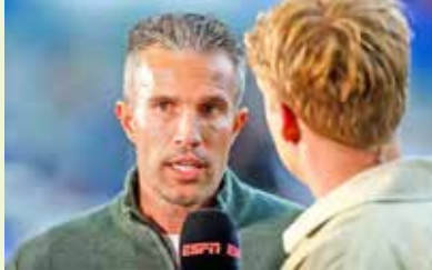
فان پرسبی: بازگشتم به آرسنال منتفی است

روبین فان پرسبی که هشت سال را در آرسنال به عنوان بازیکن گذراند و با پیران این تیم ۱۳۲ گل به ثمر رساند و جام حذفی را فتح کرد در صحبت‌هایی درباره احتمال بازگشتش به آرسنال گفت: «انتظار ندارم در آرسنال کار کنم. فکر می‌کنم درها به طور کامل بسته شده‌اند. به دلیل رفتن من به منچستر یونایتد دیگر کسی در آرسنال دوست ندارد من را در این باشگاه ببیند. این ارزیابی من است. البته شما در فوتبال هرگز نمی‌دانید چه چیزی رخ می‌دهد اما این ارزیابی من است. اکنون در هلند زندگی می‌کنم و واقعاً از حضور در اینجا لذت می‌برم و بسیار افتخار می‌کنم که مربی هیترین هستم. احساس می‌کنم در باشگاه و در میان هواداران جایگاه ویژه‌ای پیدا کرده‌ام. فکر می‌کنم این مهم است که شما احساس خوبی داشته باشید.»