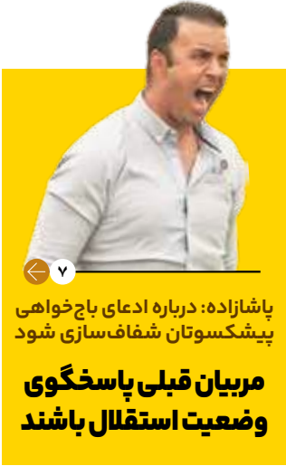
پاشازاده: درباره ادعای باج خواهی پیشکشکوتان شفاف سازی شود