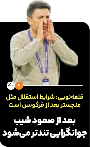
قلعه تویی: شرایط استقلال مثل منچستر بعد از فرگوسن است