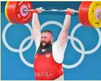
پایان افسانه غول وزنه برداری دنیا

لشاً تالاخازه که در المپیک ۲۰۱۶ ریو، بالاتر از بهداد سلیمی به عنوان قهرمانی دسته فوق سنگین وزنه برداری دست یافت، از آن به بعد بدون شکست در تمامی رقابت‌ها ظاهر شد و به ۱۰ امدال طلای جهان و المپیک دست یافت. این غول کرجستانی، سال ۲۰۲۱ و در رقابت‌های جهانی ازبکستان با مهار ۲۲۵ کیلوگرم در یک ضرب، ۲۶۷ کیلوگرم در دوشرب و ثبت مهار مجموع ۴۹۲ کیلوگرم توانست بیشترین رکوردهای ممکن تاریخ این رشته را به نام خود ثبت کند و پس از آن هم اگرچه همچنان طلای جهانی و المپیک را به نام خود ثبت کرد اما در دو سال اخیر رکوردهای او افت کرد و حالا به نظری رسد به پایان کار خود رسیده است. چرا که نام او در لیست وزنه برداران حاضر در مسابقات جهانی بحرین، دیده نمی‌شود و برای اولین بار در سال‌های اخیر مسابقات جهانی در دسته فوق سنگین بدون حضور او انجام خواهد شد. با اینکه دلیل مشخصی برای غیبت تالاخازه عنوان نشده اما به نظری رسد مصدومیت‌های متوالی و پایین آمدن سطح آمادگی او باعث شده که قید حضور در مسابقات جهانی ۲۰۲۴ را بزند.