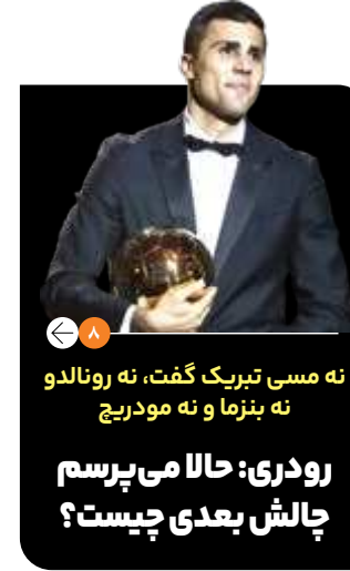
نه مسی تبریک گفت، نه رونالدو نه بنزما و نه مودریچ