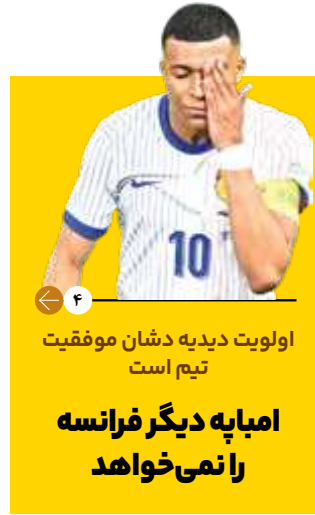
اولویت دیدیه دشان موفقیت تیم است