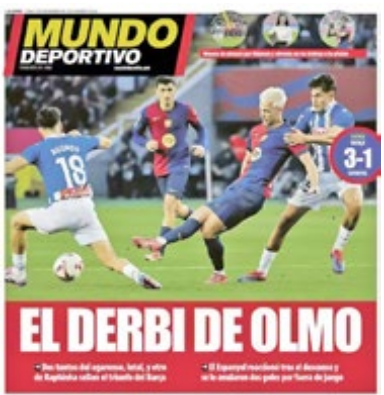
این روزنامه به درخشش اولمو در دربی کاتالونیا اشاره کرده است