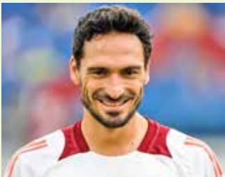
در آلمان برای هوملس سرو دست می‌شکنند

متس هوملس قرار بود حرکت بزرگ برای تقویت خط دفاعی این تیم باشد. با این حال، مدافع سابق بوروسیا دورتموند تاکنون نتوانسته ایوان یوریچ را متقاعد کند. این مربی بارها اعلام کرده که مدافع آلمانی جانشین ایوان اندیکا است، بازیکنی که در این فصل برای رم فیکس بازی کرده است اما در حالی که در پایتخت ایتالیا، تماشاگران اغلب تعجب می‌کنند که چرا هوملس بازی نمی‌کند، در آلمان، هواداران برای از دست دادن این بازیکن ناراحت هستند. در این میان، بیلد گزارش داده، علاوه بر علاقه زیاد هواداران به این بازیکن، مدافع رم می‌تواند برای ۸ تیم دیگر بوندس لیگا مفید باشد. بنابراین اعلام این نشریه آلمانی، بوروسیا دورتموند، بایرلورکوزن، آینتراخت فرانکفورت، اشتوتگارت، بوروسیا مونیخن گلادباخ و آکسبورگ، باشگاه‌هایی هستند که می‌توانند برای بازگرداندن هوملس به آلمان علاقه نشان دهند. علاوه بر این، دو باشگاه دیگر در دسته دوم آلمان هم وجود دارند: هامبورگ و هرتابرلین. به این ترتیب اگر جای برای هوملس در رم نباشد، در آلمان برای استقبال از بازگشت او صف می‌کشند و مشتریان زیادی دارد.