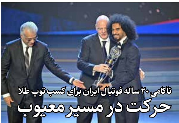
ناکامی ۲۰ ساله فوتبال ایران برای کسب توپ طلا حرکت در مسیر معیوب

آسیا حرف اول را بزند و در زمین مسابقه همه نگاه‌ها را مبهوت خودش کند، ندارد، سیستمی معیوب که با وجود پول و امکاناتی که در دو دهه گذشته نسبت به قبل بیشتر شده است، نتوانسته خروجی شگفت‌انگیزی داشته باشد. فوتبال ایران برای موفقیت همه‌جانبه در آسیا چه در کسب عناوین تیمی مانند جام ملت‌ها و لیگ نخبگان و چه عناوین انفرادی مانند توپ طلای آسیا، قبل از بودجه و امکانات بیشتر به تغییر و خانه‌تکانی در سیستم مدیریتی احتیاج دارد. آن روز مانند مراسم امسال، فوتبال ایران دور از جمع برترین‌ها نخواهد بود و حسرت رسیدن یک بازیکن ایرانی مانند امروز دیگر بیش از ۲۰ سال طول نخواهد کشید. این همان راهی است که دنیا تجربه کرده است، راهی که انگار در کشورمان اصرار بر حرکت در مسیر عکس آن وجود دارد.