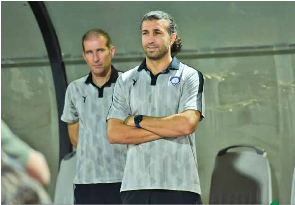
بازیکنان کنونی ما به این باور نرسیده‌اند که می‌توانند بهترين باشند