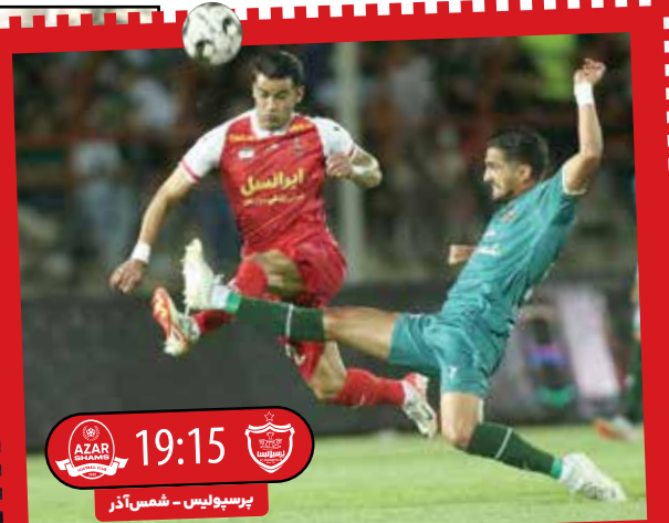
۱۹:۱۵ پرسپولیس - شمس آذر