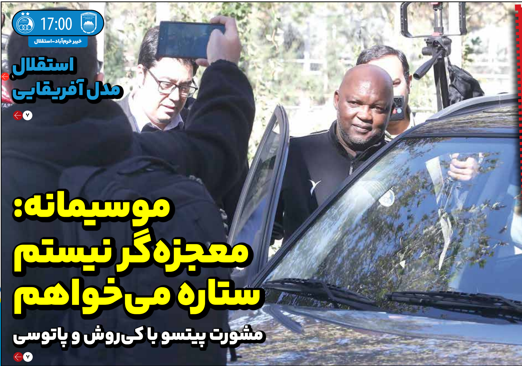
۱۷:۰۰ خیر خرم‌آباد - استقلال