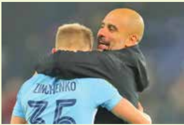
واکنش جالب گواردیولا به اعتراض زینچنکو

الکساندر زینچنکو مدافع اوکراینی آرسنال هم به آن دسته بازیکنانی پیوست که کتاب منتشر کرده‌اند. او در بخشی از کتابش، خاطره‌ای از مواجهه‌اش با روی خشمگین پپ گواردیولا بیان کرده است. مدافع سابق منچستر سیتی نوشته: «یک روز گواردیولا در تمرین از من به خاطر یک پاس بد انتقاد کرد. با صدای بلند گفتم مری، فقط یک پاس بد دادم، واکنش او حیرت‌آور بود؛ او به من گفت: اوه، اوکی، معذرت می‌خواهم آقای زینچنکو، منو ببخش. بعد رو به بقیه کرد و گفت: خیلی ممنون بچه‌ها، همه داخل ختکن، تمرین تموم شد. همه این اتفاقات فقط به خاطر این بود که من زبان درازی کردم و به او جواب دادم. همان موقع هم می‌دانستم که به در در افتادم. بازی بعد نیکمت نشین شدم. همان موقع هم می‌دانستم کارم درست نبود اما خیلی احقرانه می‌شد اگر بلافاصله به دفتر او می‌رفتم تا عذرخواهی کنم. روز قبل از بازی بود و ذهن او درگیر تاکتیک تیم برای مسابقه فردا، با این حال پس از پایان آن بازی از او عذرخواهی کردم.»