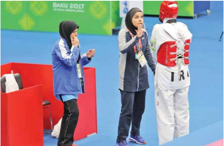
هیچ اهمیتی ندارد. حتی در عین نایب‌وزی وزارت ورزش هیچ پاداشی برای تیم نونهالان در نظر نمی‌گیرد، و اصلاً این رده را تیم ملی نمی‌داند، در صورتی که این بچه‌ها بیشتر از هر رده‌ای نیاز به حمایت دارند و