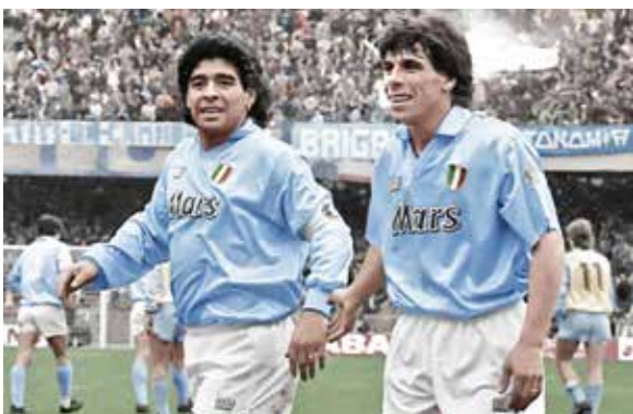
جان فرانکو زولا، مهاجم سابق تیم ملی ایتالیا و دیگو مارادونا کاپیتان فقید تیم ملی آرژانتین از سال ۱۹۸۹ تا ۱۹۹۱ تشکیل دهنده زوج خط حمله زهره دار ناپولی بودند و گل های بسیاری را با پیراهن ناپلینوی به ثمر رساندند. زولا، در گفتگو با تاکاسپورت در مورد روزهای هم تیمی بودن با مارادونا و همچنین شخصیت این اسطوره فوتبال جهان صحبت کرد. زولا گفت: «من و دیگو دو فرد کاملاً متفاوت از یکدیگر بودیم. شاید باور نکنید، مارادونا

در خلوت بسیار آرام و متواضع تر از حضور در جمع بود.» او در مورد اولین مکالمه خود با مارادونا بعد از پیوستن به ناپولی گفت: «یادش می آید. اولین چیزی که او با دیدن من در تمرینات ناپولی گفت این بود که بالاخره با بازیکنی که از خودش کوتاه تر است، قرارداد امضا کرده اند. مارادونا از این بابت خوشحال شد و با من شوخی می کرد. البته باید این را بگویم که مارادونا تنها به خاطر فرم موهایش از من بلندتر به نظر می رسید.»