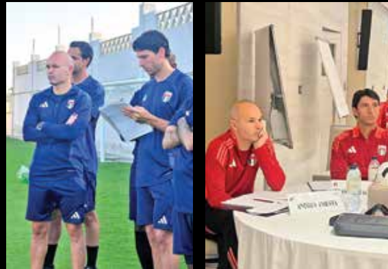
آندرس اینیستا با گذشت تنها ۱۰ روز از خدا حافظی از دنیای فوتبال، قدم جدیدی در حرفه خود برداشتم و وارد حیطه مربیگری شد. ستاره سابق اسپانیا و بارسلونا، در کشور امارات که آخرین ایستگاه دوران حرفه ای او بود، در دوره اخذ مدرک مربیگری شرکت کرده و حالا تصاویر زیر را در شبکه های اجتماعی منتشر کرده است.