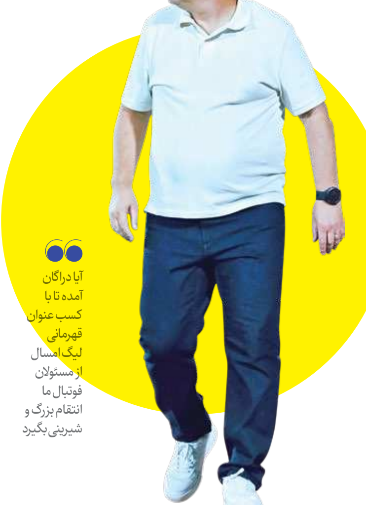
آیا دراگان آمده تا با کسب عنوان قهرمانی لیگ امسال از مستولان فوتبال ما انتقام بزرگ و شیرینی بگیرد