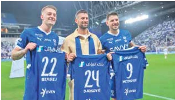
در اقدامی جالب، پیراهن شماره ۲۴ الهلال به نشانه تعداد گردناسلم های نوک جوکوویچ (بیشترین در تاریخ)، به این ستاره بزرگ تنیس جهان اهدا شد.