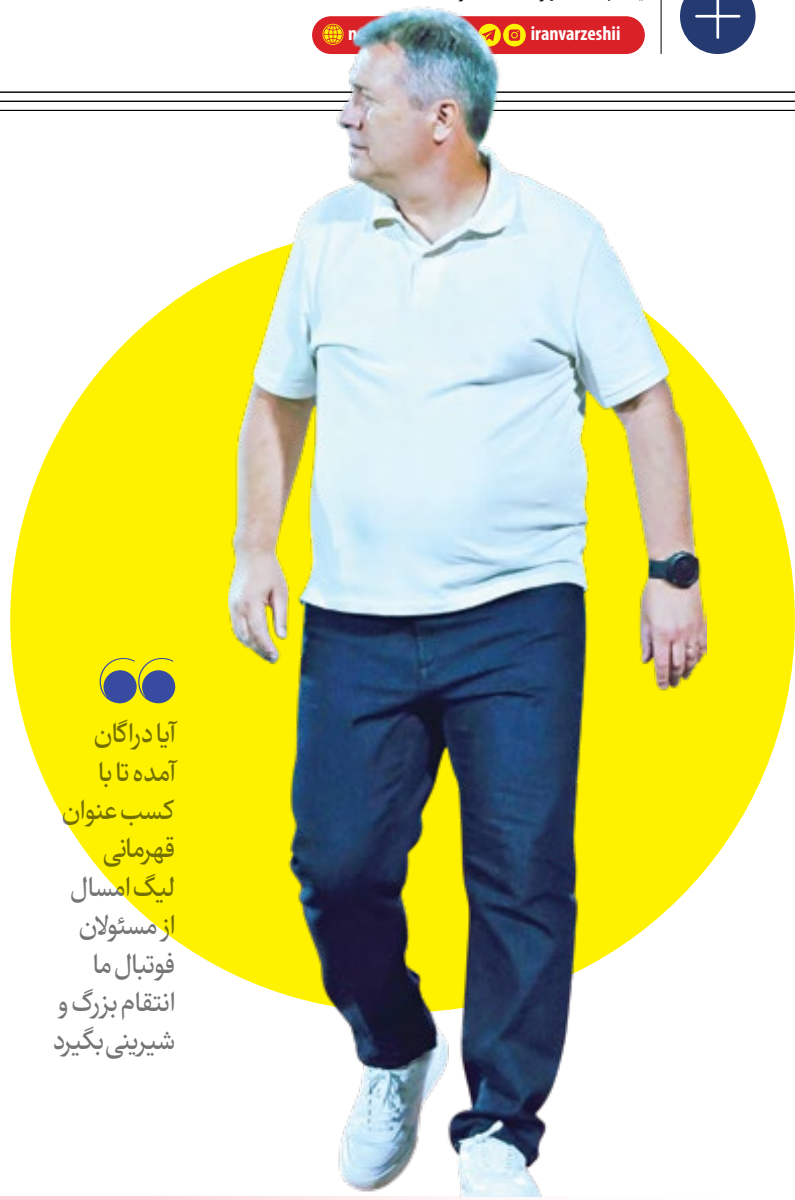
آیا درآگان آمده تا با کسب عنوان قهرمانی لیگ امسال از مستولان فوتبال ما انتقام بزرگ و شیرینی بگیرد