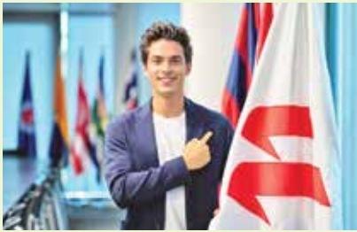
یک هوش مصنوعی عضو جدید لالیگا شد

الکس یک هوش مصنوعی است و لالیگا روز پنجشنبه در رویدادی از او رونمایی کرد. هدف از این اقدام افزایش کانال‌های ارتباطی لیگ با هواداران است.