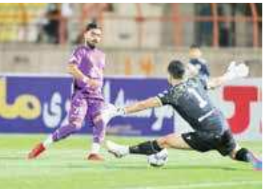
شمس آذر یک