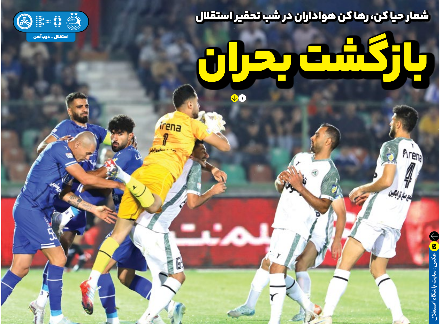
استقلال - ذوب‌آهن

به تمام رؤیاهای کودکی‌ام رسیدم مسی: افتخاراتم را نمی‌شمارم