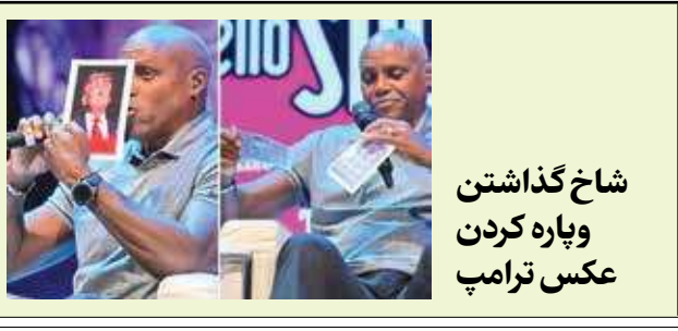
شاخ گذاشتن وپاره کردن عکس ترامپ

کارل لوئیس، قهرمان سابق دوومیدانی جهان که چندین مدال طلا در مسابقات المپیک را هم کسب کرده، شنبه شب در فستیوال تزنو اسپورت در ورزشگاه چپارا حضور پیدا کرد و به سخنرانی برای هوادارانش پرداخت اما اتفاق جالب زمانی رخ داد که تصاویری از چهره‌های سرشناس آمریکایی مقابل لوئیس قرار داده شد و از او خواستند که درباره آنها نظر بدهد. لوئیس که همیشه به تلاش هایش برای حفظ حقوق شهروندی و از بین بردن تبعیض و نژادپرستی و نژادپرستانه معروف بوده، وقتی با عکسی از دونالد ترامپ روبه‌رو شد که در حال حاضر نامزد حزب جمهوریخواه برای انتخابات ریاست جمهوری امریکاست، درخواست یک خودکار کرد و دو شاخ روی پیشانی رئیس جمهور سابق امریکا کشید که با استقبال تماشاگران هم روبه‌رو شد و خطاب به آنها گفت: «فکر می‌کنم همه ما موافق باشیم که این طوری بهتر است» و سپس عکس ترامپ را پاره و تکه‌هاش را روی صحنه پرتاب کرد.