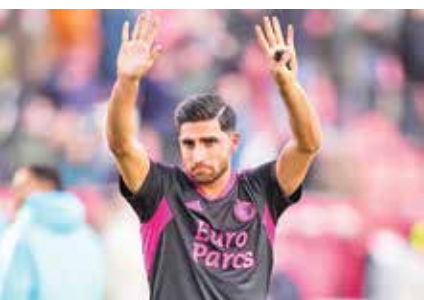
انتقال بزرگ برای کاپیتان تیم ملی