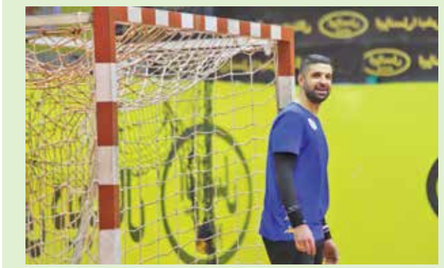
هندبال پرساغاری خبرنگار

رافائل کاستلو اسپانیایی، دوباره سرمربی تیم ملی هندبال ایران شد. او برگشت تا خاطرات خوش سومی آسیا و اولین سهمیه جام جهانی برای هواداران ندای شود. هرچند همان موقع در حق سرمربی اسپانیایی کوتاهی شد و با حذف اسمش از لیست کادر فنی تیم ملی در جام جهانی ۲۰۱۶ کار کرد، او در تیم العربی قطر هم دو سال سرمربی‌ام بود. فکرمی‌کنم یکی از بزرگ‌ترین مربیانی بود که در تاریخ هندبال کشورمان به ایران آمده است. در آن زمان که سرمربی تیم ملی بود، ما نتایج خیلی خوبی گرفتیم. به نظر تصمیم فدراسیون خیلی خوب بود. او مربی نام‌آشنایی در اسپانیا و جهان است و حتی جزو بهترین بازیکنان جهان هم بوده. کاستلو دو سال قبل سرمربی تیم ادمارلئون اسپانیا، تیم فعلی من بود.» دروازه‌بان با خوشحالی از برگشت رافائل کاستلو می‌گوید: «مطمئنم با این مربی اسپانیایی دوباره به سهمیه جهانی می‌رسیم.» او ورزش‌های خوش با کاستلو در سال‌های نه‌چندان دور را مرور می‌کند: «با رافائل تقریباً دو