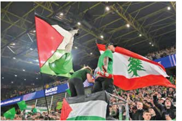
حمایت هواداران سلتیک از فلسطین و لبنان در حاشیه بازی مقابل دورتموند در استادیوم سینگنال ایدونا پارک