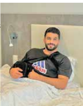
حسن یزدانی: بزودی برمی‌گردد

حسن یزدانی نایب قهرمان ایران در المپیک ۲۰۲۴ بعد از جراحی اخیرش در کشور فرانسه پیامی اینستاگرامی را در صفحه شخصی‌اش به اشتراک گذاشت و نوشت: «همانطور که می‌دانید عمل کتف بنده انجام شد و به لطف پروردگار و دعای شما مردم عزیز کشورم که همیشه و همه‌جا پشتوانه بزرگ این سرباز وطن بودید، بسیار موفقیت‌آمیز بود. در وهله اول از دکتر دبیر رئیس فدراسیون و دکتر کیهانی پزشک فدراسیون نهایت تشکر را دارم که در این مدت کوتاه از هیچ تلاشی برای من دریغ نکردند و تمام شرایط را در بهترین حالت ممکن برای این مهم فراهم و مهیا نمودند تا به امید خدای متعال و دعای خیرتان در آینده‌ای نه چندان دور، بعد از گذراندن مراحل درمان کامل خود بزودی باز هم به میادین برگردم و تمام تلاش خود را برای سربلندی مردم عزیز و لایق کشورم به‌کار بگیرم. به امید دیدار شما عزیزان در میادین بزرگ.»