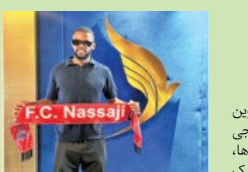
یامگا به نساجی پیوست

دانش اما شکی نیست که از درون مجموعه افکار و طرح های این مربی و سران چادرملو چیزهایی به بیرون تراوش نکرده که لازمه ابقا در لیگ است. چادرملو در ازای دو شکست و یک تساوی که کسب کرده، فقط به یک برد رسیده که در هفته چهارم و نتیجه ۰-۱ مقابل تیم قعرنشین نساجی بوده است و با اینکه قیاس مستقیم نتایج این تیم با دیگر میهمان تازه لیگ برتر (خیبر خرم آباد) شاید مقایسه صحیحی نباشد اما باید متذکر شد که خیبری با کارنامه ای بالنسبه بهتر و با اندوختن پنج امتیاز در جایگاه هفتم جدول نشسته اند. فاصله امتیازی بسیار کم تیم ها در کمرکش جدول، به این معناست که فقط یک برد دیگر برای مردان اخباری و ناکامی تیم های دور و بر چادرملو در جدول زده بندی وضع نابسامان این تیم را در یک چشم به هم زدن دگرگون خواهد کرد اما نکته