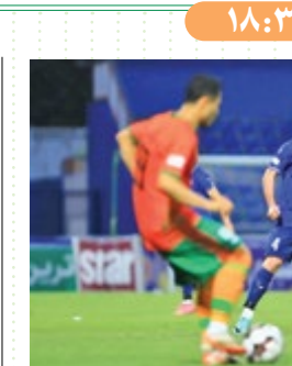
مس رفسنجان- گل گهر سیرجان