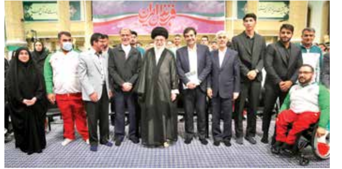
رهبر انقلاب در دیدار ملی‌پوشان المپیک و پارالمپیک تأکید کردند