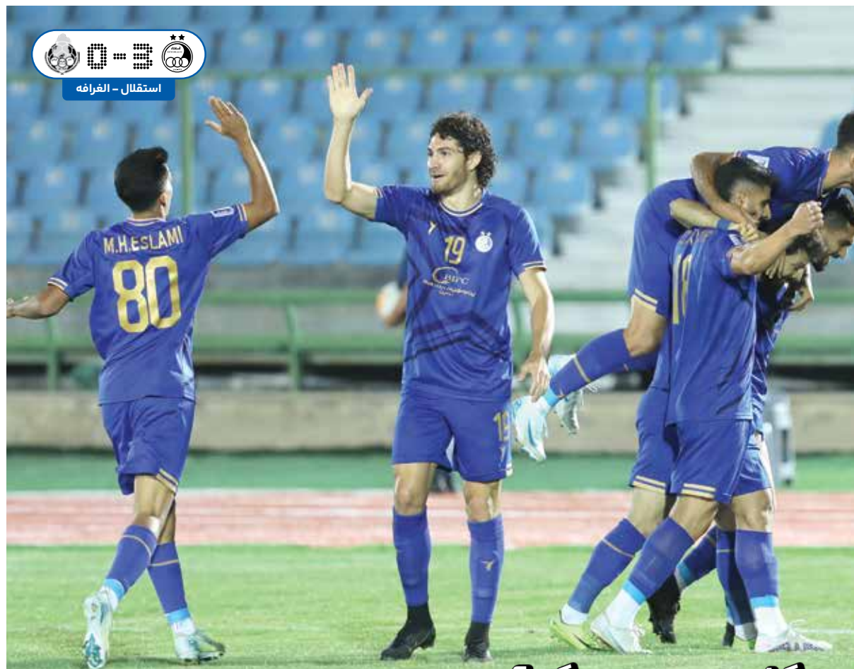
بازگشت امید به اردوگاه آبی