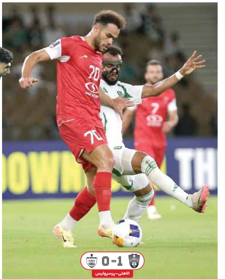
افسوس برای توپ هایی که گل نشد