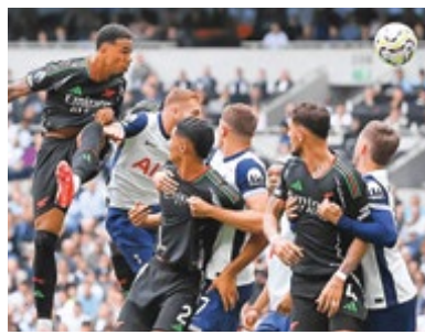
با دفاع منسجم و ضد حملات