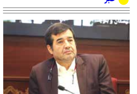
نباید فشار روی توکاندو و کشتی باشد