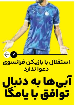
استقلال با بازیکن فرانسوی دعوا ندارد آبی‌ها به دنبال توافق با یامگا