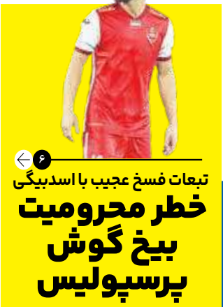
تبعات فسخ عجیب با اسدیبگی خطر محرومیت بیخ گوش پرسپولیس