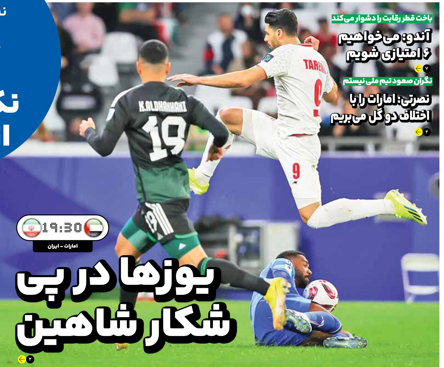
باخت قطر رقابت را دشوار می‌کند