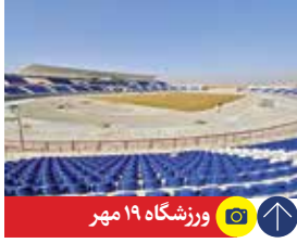
ورزشگاه ۱۵ هزار نفرى

۱۵ هزار نفر اواخر دهه ۸۰ به بعد استادیوم‌هایی با گنجایش تقریباً ۱۵ هزار نفر در بسیاری از شهرها ساخته شد که حالا چندان خبری از برگزاری مسابقات و خوب بودن شرایط آنها به گوش نمی‌رسد. با این حال، احمد دنیا‌مالی، وزیر ورزش و جوانان، در خصوص شرایط استادیوم‌ها و اعتبار و بودجه موردنیاز برای این پروژه گفت: «ما اصلاً مشکل اعتبار نداریم. من یکی از کارهایی که در دستور کار خودم قرار دادم این است که استانداردهای ورزشگاه‌ها بر اساس چهارچوب‌هایی که AFC یا فیفا برای فوتبال می‌گذارند، انجام شود. اینها کار سختی نیست.»