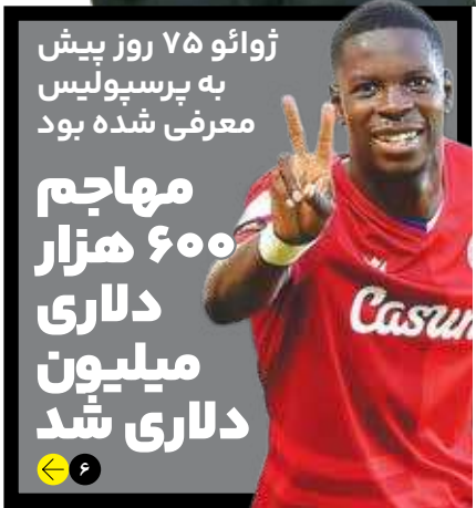
ژوآو ۷۵ روز پیش به پرسپولیس معرفی شده بود مهاجم ۶۰۰ هزار دلاری میلیون دلاری شد