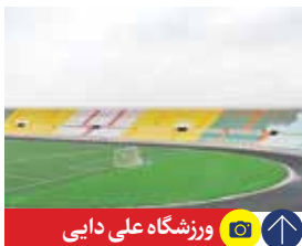
ورزشگاه علی دایى

شیرودى بازنشسته شد این شرایط در حالی به وجود آمده که جست وجویی ساده نشان می‌دهد در ایران، حداقل ۴۳ ورزشگاه مهم برای برگزاری بازی‌های فوتبال وجود دارد اما تنها برخی از آنها وضعیت نسبتاً مطلوبی دارند، بسیاری از آنها شرایط ایده‌آلی ندارند و تعدادی هم برای برگزاری بازی‌های مهم مناسب نیستند. نمونه این استادیوم‌ها، ورزشگاه شهید شیرودى تهران است که در سال ۱۳۱۸ تأسیس شد و تا قبل از ساخت ورزشگاه آزادی، مهم‌ترین استادیوم ایران به شمار می‌رفت اما حالا مدت‌هاست بازی‌های فوتبالی در آن برگزار نمی‌شود. بافت فرسوده ورزشگاه، کمبود فضای ورزشی، دسترسی‌های نامناسب برای استفاده از این مجموعه، کمبود فضای پارکینگ برای ورزشکاران، نبود فضای لازم برای تجهیز لوازم و امکانات ورزشی و کمبود فضای سبز از جمله مواردی بود که باعث شد این استادیوم پیرمنطقه امجدیه، بازنشسته شود!