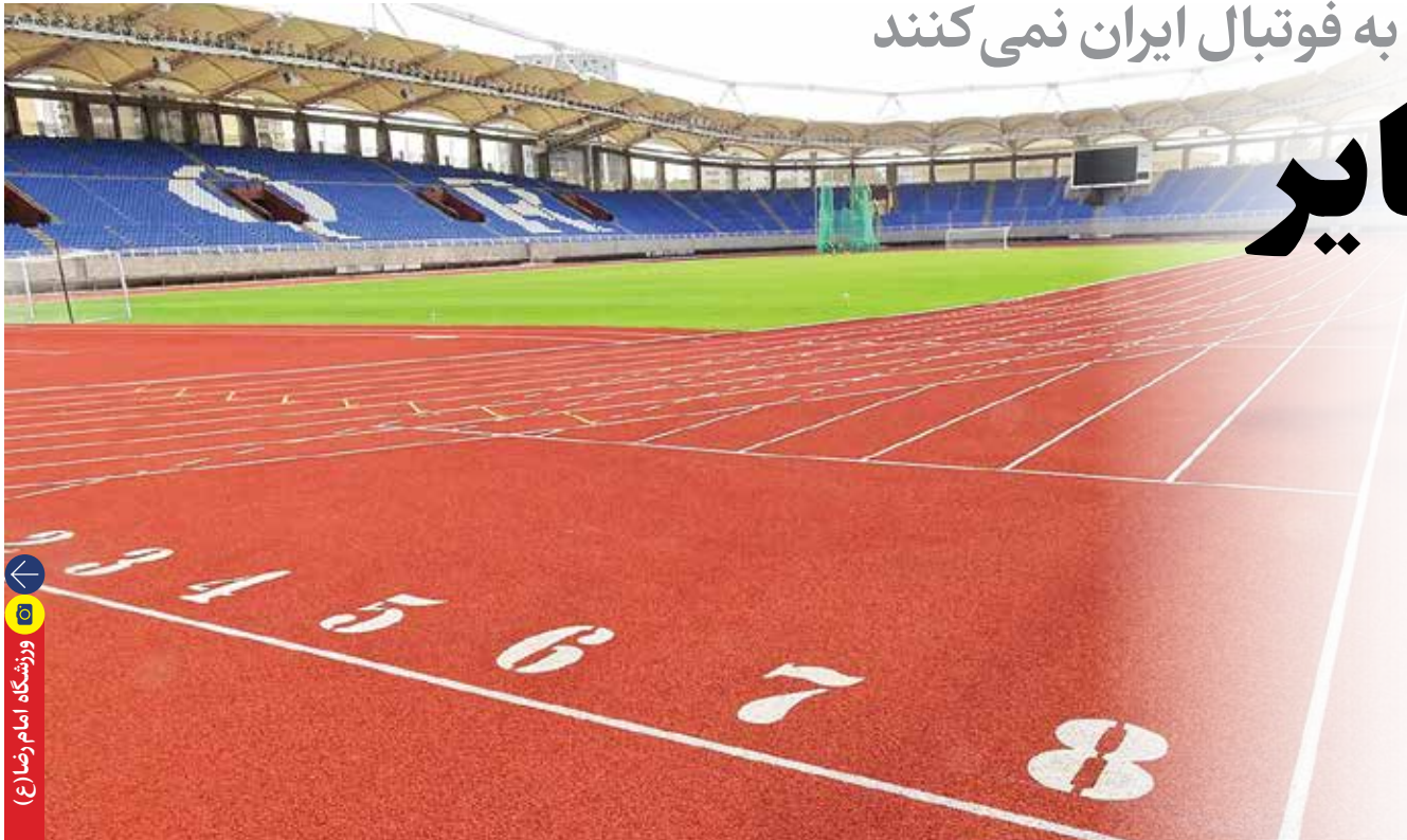
ورزشگاه امام رضا(ع)

دو بازی از مسابقات خانگی شان را در ورزشگاه‌های امام خمینی (ره) اراک و سردار آزادگان قزوین انجام داده‌اند و استقلال هم یکی از بازی‌های خانگی اش را در قزوین برگزار کرده است. این در حالی است که تیم ملی هم پس از اینکه مجوز بازی در ورزشگاه امام رضا(ع) مشهد را پیدا نکرد، راهی اصفهان شد و بازی‌اش برابر قرقیزستان در مرحله مقدماتی جام جهانی ۲۰۲۶ را در ورزشگاه فولادشهر برگزار کرد. هرچند که این استادیوم اختصاصی باشگاه ذوب‌آهن، با وجود تلاش‌های فراوانی که صورت گرفته بود، از چمن ایده‌آلی برخوردار نبود که این موضوع حتی از تلویزیون هم قابل مشاهده بود و به قول معروف توی ذوق می‌زد.