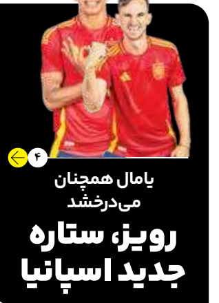
یامال همچنان می‌درخشد رویز، ستاره جدید اسپانیا