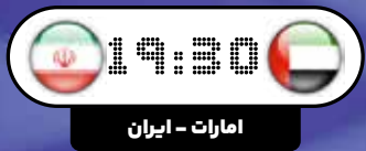
امارات - ایران