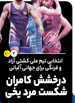
انتخابی تیم ملی کشتی آزاد و فرنگی برای جهانی آلبنی درخشش کامران شکست مرد یخی