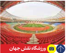
ورزشگاه نقش جهان