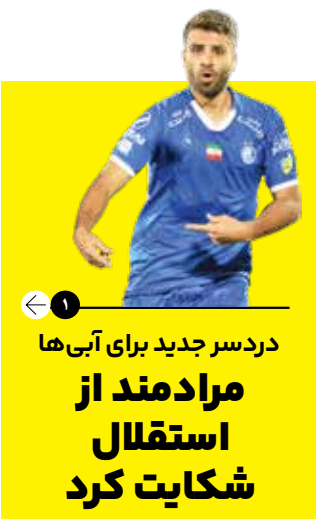
دردسر جدید برای آبی‌ها مرادمند از استقلال شکایت کرد