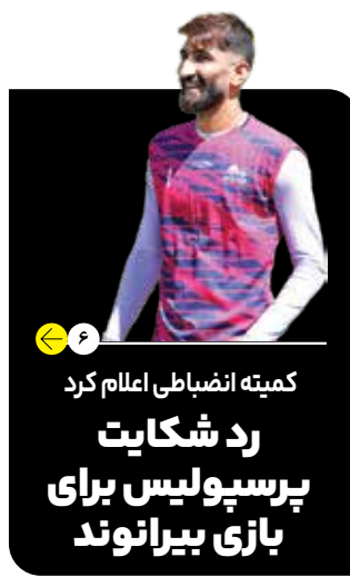
کمیته انضباطی اعلام کرد رد شکایت پرسپولیس برای بازی بیرانوند