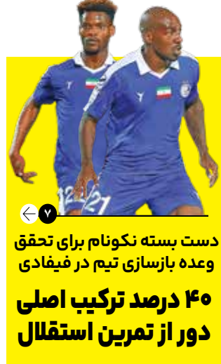
دست بسته نکونام برای تحقق وعده بازسازی تیم در فیفادی ۴۰ درصد ترکیب اصلی دور از تمرین استقلال