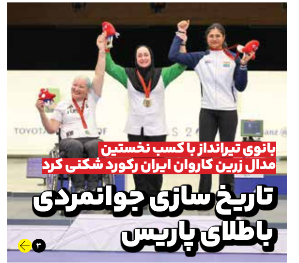
بانوی تیرانداز با کسب نخستین مدال زرین کاروان ایران رکورد شکنی کرد