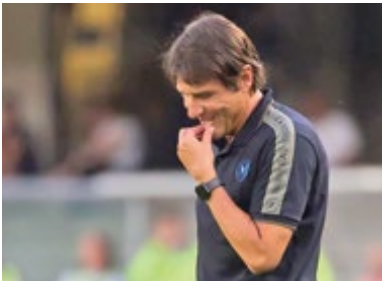
شروع کابوس وار کونته در ناپولی