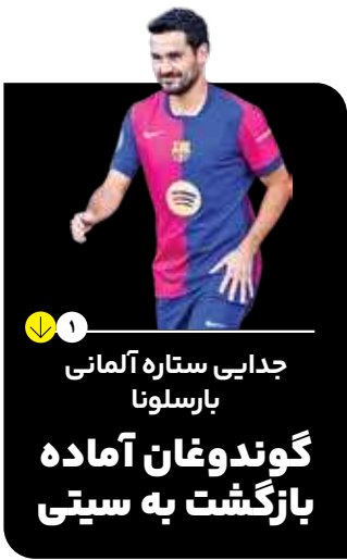
۱ | جدایی ستاره آلمانی بارسلونا گوندوغان آماده بازگشت به سیتی