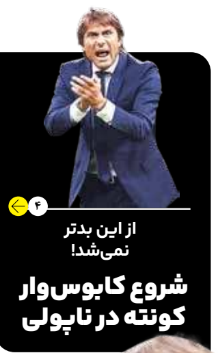
۴ | از این بدتر نمی شد! شروع کابوس وار کوتنه در ناپولی