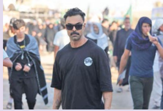
● تصاویری از راهپیمایی ورزشکاران، قهرمانان، ملی پوشان، پیشکسوتان ورزشی و هنرمندان در راهپیمایی اربعین حسینی