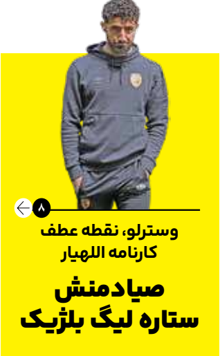
۸ | وسترلو، نقطه عطف کارنامه اللهیار صیادمنش ستاره لیگ بلژیک