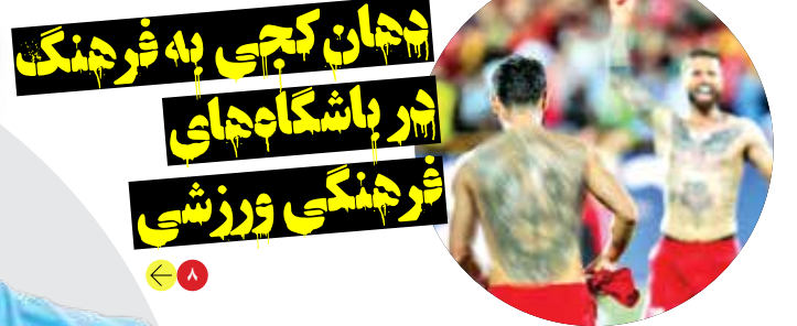
۸ | جهان کجی به فرهنگ در باشگاه های فرهنگی ورزشی