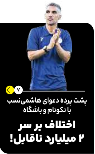
۷ | پشت پرده دعوی هاشمی نسب با نکونام و باشگاه اختلاف بر سر ۲ میلیارد ناقابل!