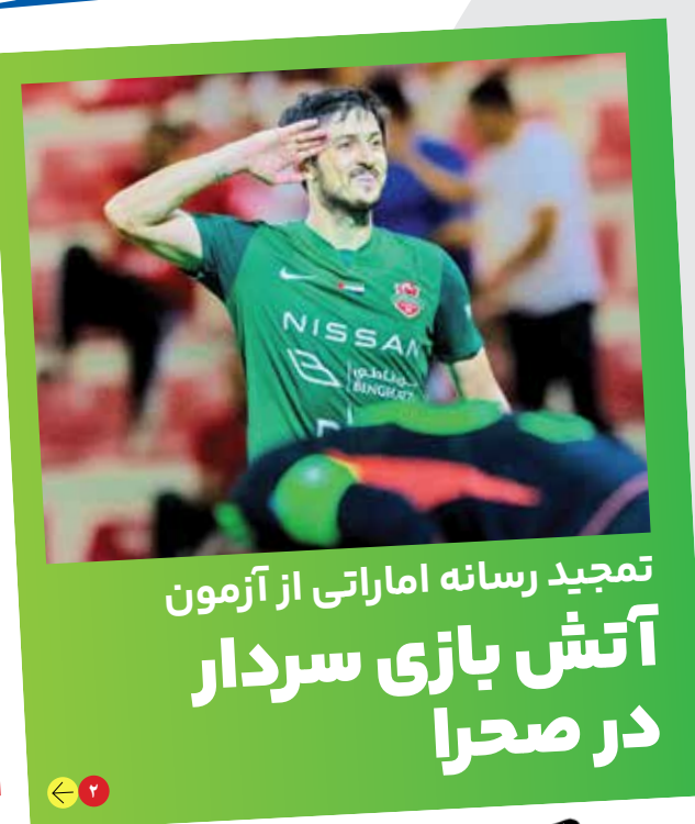
۷ | تمجید رسانه اماراتی از آزمون آتش بازی سردار در صحرا