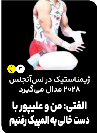
ژیمناستیک در لس‌آنجلس ۲۰۲۸: مدالی می‌گیرد