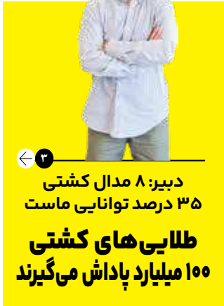
دبیر: ۸ مدال کشتی ۳۵ درصد توانایی ماست