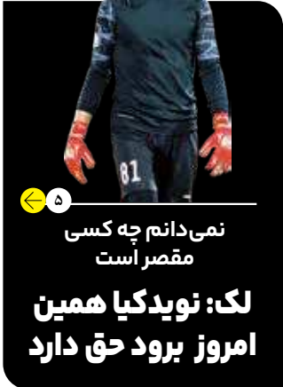
نمی‌دانم چه کسی مقصر است