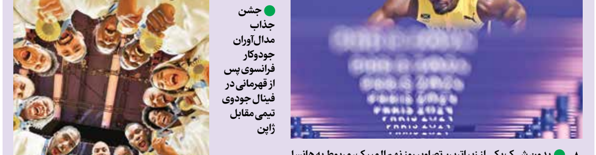
بدون شک یکی از زیباترین تصاویر روز نهم المپیک، مربوط به هانس جامائیکایی است؛ او مشغول گذر از موانعی است که روی آنها نام المپیک پاریس درج شده