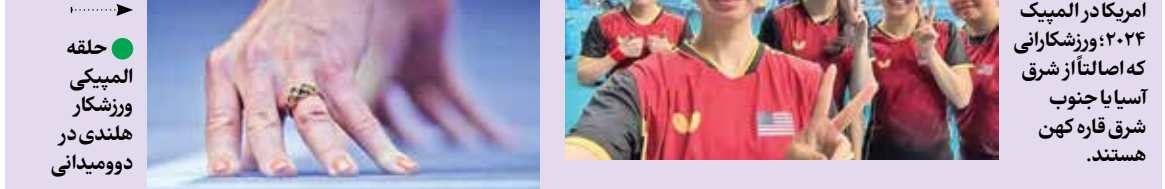
عجیب‌ترین بازیکنان تیم ملی تنیس آمریکا در المپیک ۲۰۲۴؛ ورزشکارانی که اصالتاً از شرق آسیا یا جنوب شرق قاره کهن هستند.