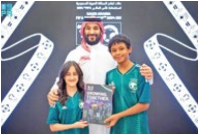
پیشنهاد بن سلمان روی میز ایفاناتیو