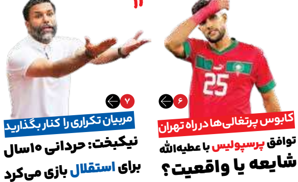
مربیان تکراری را کنار بگذارید توافق پرسپولیس با عبیدالله شایعه یا واقعیت؟ برای استقلال بازی می‌کرد