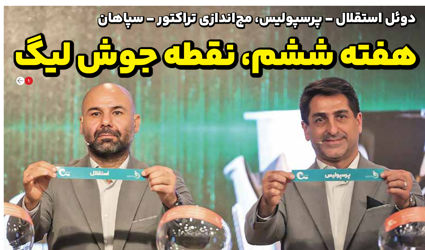
دوئل استقلال - پرسپولیس، مچ اندازی تراکتور - سپاهان