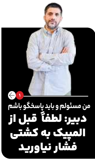
من مسئولم و باید پاسخگو باشم دبیر: لطفاً قبل از المپیک به کشتی فشار نیاورید