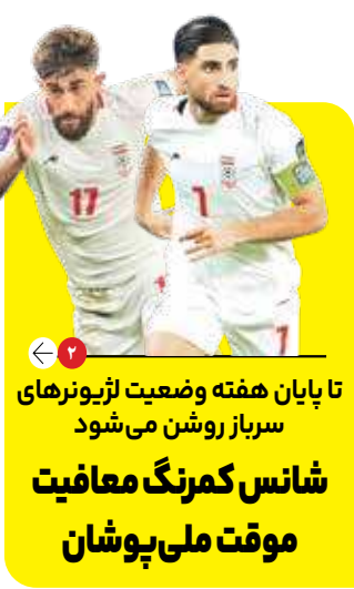
تا پایان هفته وضعیت لژیونریهای سرباز روشن می‌شود شانس کمرنگ معافیت موقت ملی‌پوشان