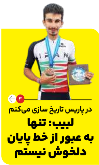
در پاریس تاریخ سازی می‌کنم لبیب: تنها به عبور از خط پایان دلخوش نیستم