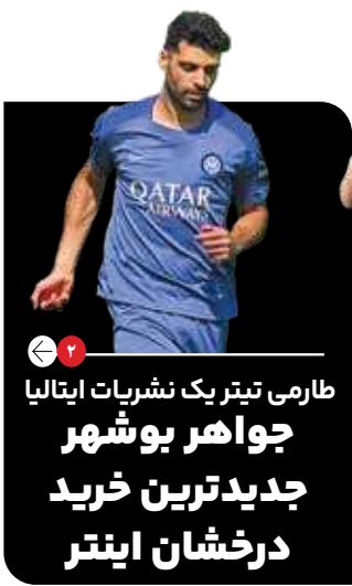
طرمی تیرت یک نشریات ایتالیا جوهر بوشهر جدیدترین خرید درخشان اینتر