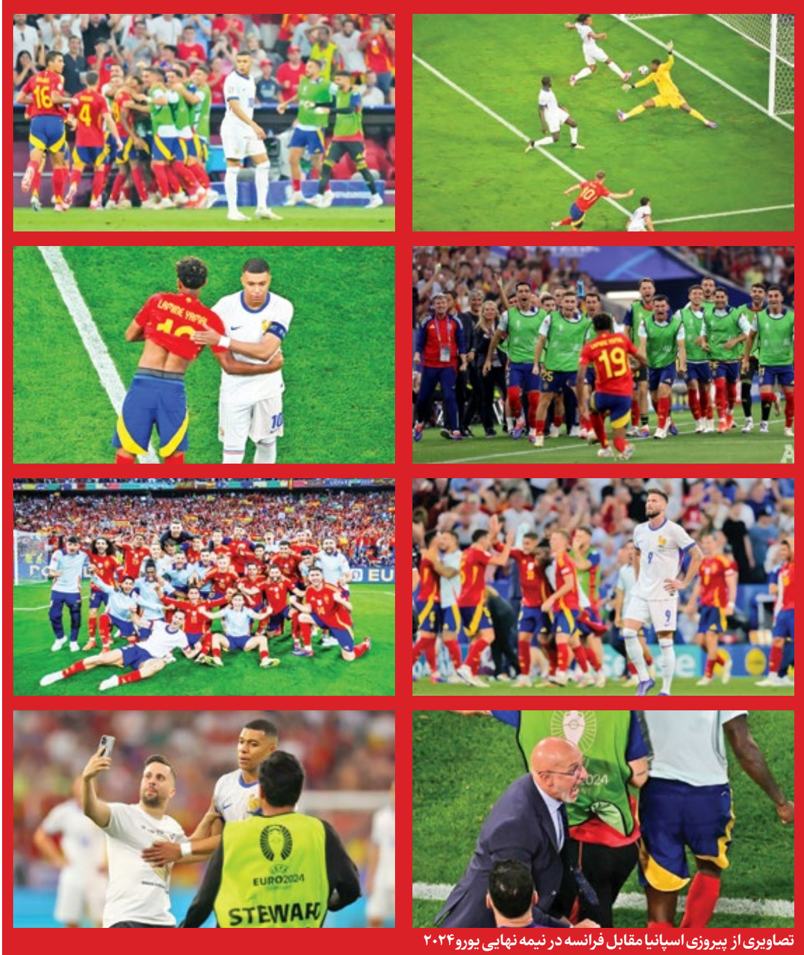
تصاویری از پیروزی اسپانیا مقابل فرانسه در نیمه نهایی یورو ۲۰۲۴