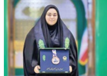
مسابقات جهانی صاحب مدال کند.