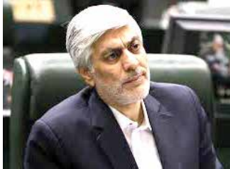
می‌کنم. امیدوارم نتیجه هرچه می‌شود به خیر و صلاح مردم باشد و آنها لذت آن را ببرند.»

مطمئناً با بررسی نتایج و رمزگشایی کارآگاهان زنده از بازجویی‌های صورت گرفته از متهمان پای دانه‌درشت‌ها نیز بزودی به این پرونده باز خواهد شد تا این واقعیت روشن شود که ماه هیچ‌گاه پشت ابر باقی نخواهد ماند. به نظر تابستانی داغ در انتظار فوتبال ایران خواهد بود و متخلفان سایه نشین حالا باید به فکر جواب‌پس دادن باشند.