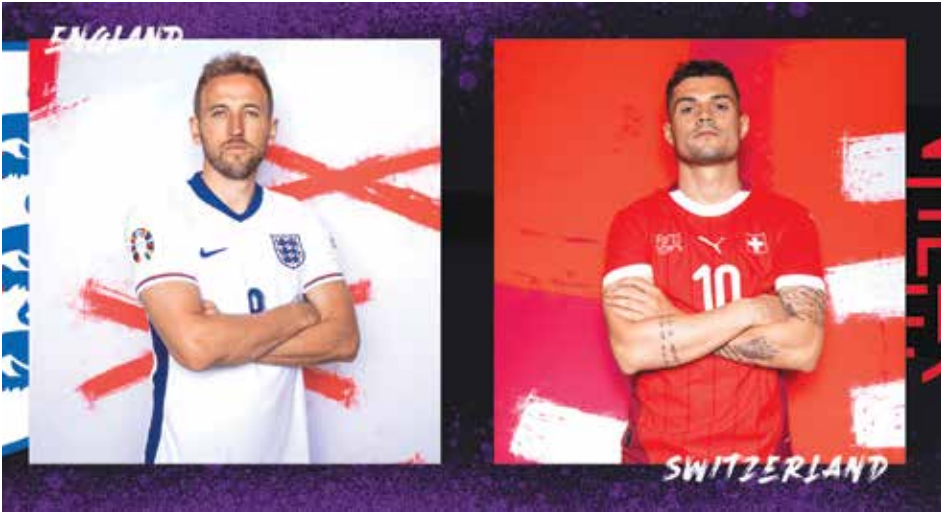
سوییس به دنبال شکستن طلسم ۴۳ ساله

جود بلینگام، ستاره تیم ملی انگلیس و ژنرال مادرید، به دلیل حرکات جنجالی خود در جریان پیروزی ۱-۲ انگلیس مقابل اسلواکی در یورو ۲۰۲۴ یک جلسه محروم شد ولی می‌تواند برابر سوئیس بازی کند. این محرومیت او تعلیقی و به مدت یک سال است و در صورت تکرار در این بازه زمانی، اعمال خواهد شد. یوفا تحقیقاتی را در این باره آغاز کرده بود، اما به جای محرومیت از بازی، این بازیکن را با جریمه نقدی ۳۰ هزار یورویی مواجه کرد. در واقع یوفا قاضی جنجالی خود را در حدی ندانست که بخواد او را قاضی محروم کند. پس از جشن گرفتن با هواداران، بلینگام در حال دیدن به سمت خط میانه زمین بود که در مقابل نیمکت تیم حریف یک حرکت ناشایست و جنجالی انجام داد. بلینگام پس از بازی توضیح داد که این حرکات به عنوان یک شوخی داخلی با دوستانش بوده است، اما این توضیح مانع از دخالت یوفا نشد.