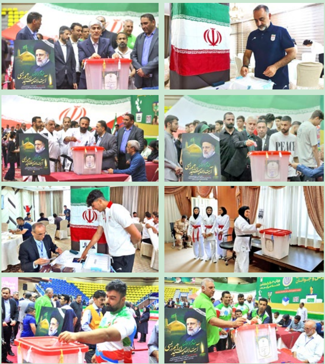
حضور پرشور ورزشکاران در دور دوم انتخابات ریاست جمهوری ۱۴۰۳