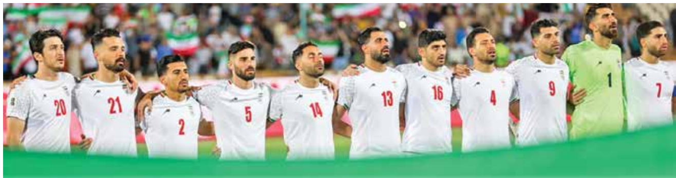
بودجه ناچیز تیم ملی نسبت به رقبای قدرتمند آسیایی