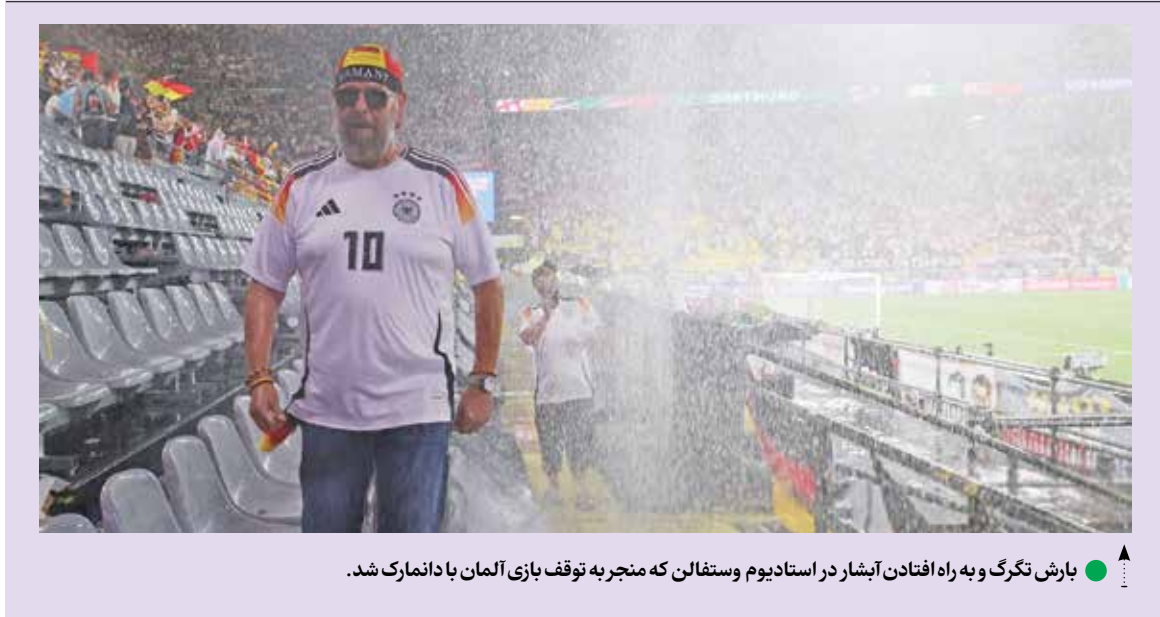
بارش تگرگ و به راه افتادن آبشار در استادیوم وستفالن که منجر به توقف بازی آلمان با دانمارک شد.