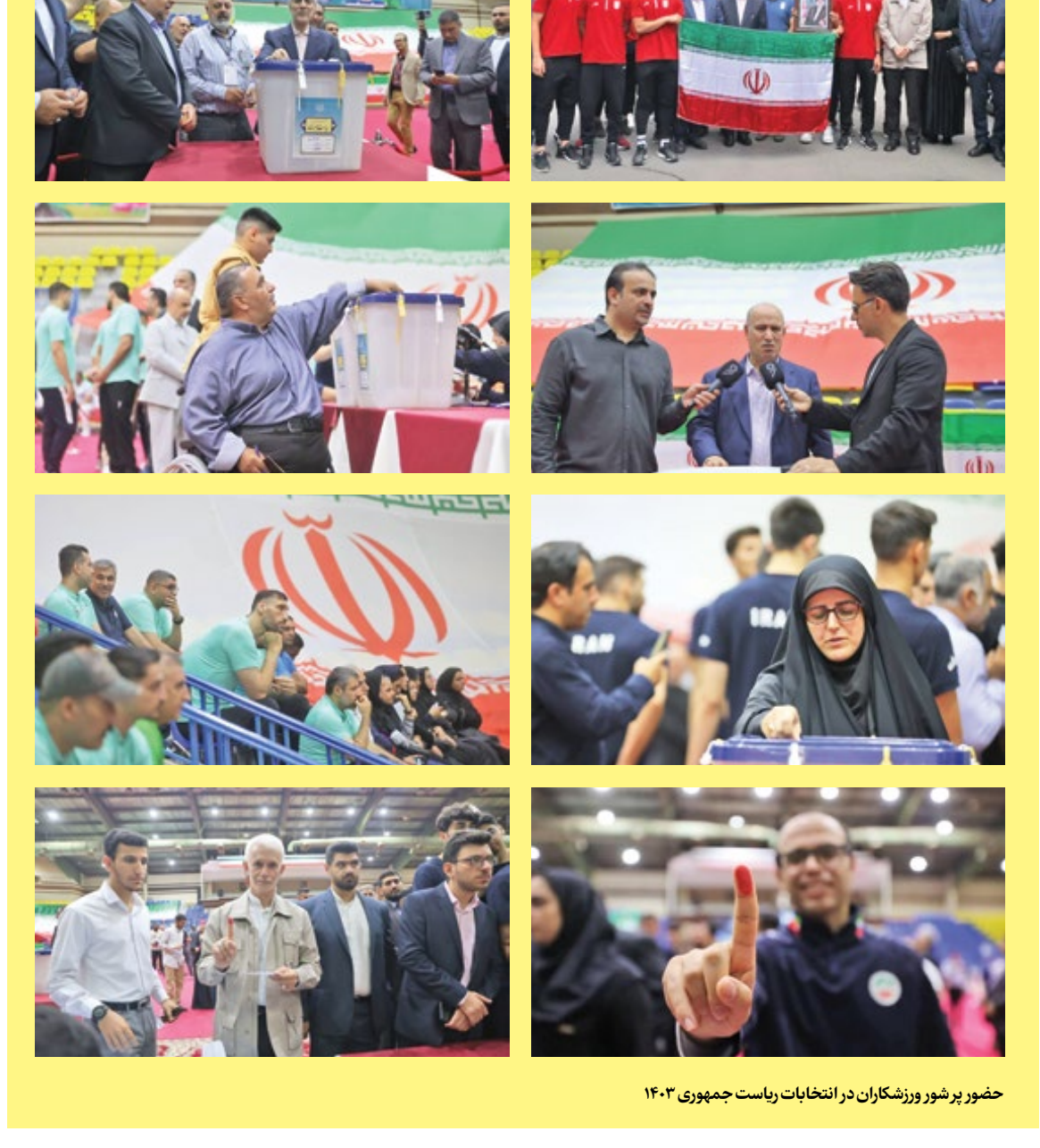
حضور پر شور ورزشکاران در انتخابات ریاست جمهوری ۱۴۰۳