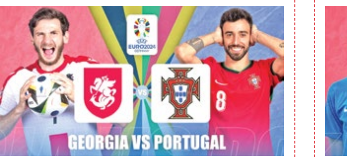
رقبای آشنای دور آخر: گرجستان-پرتغال، اسلواکی-رومانی