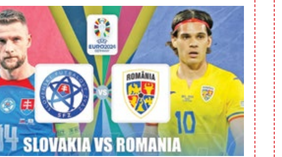
رقبای آشنای دور آخر: گرجستان-پرتغال، اسلواکی-رومانی