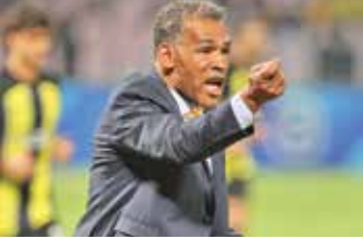
تصمیم قابل پیش بینی سرمربی سپاهان