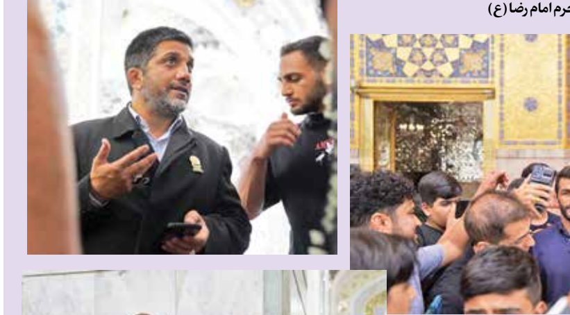
حضور اعضای تیم ملی کشتی آزاد در حرم امام رضا (ع)