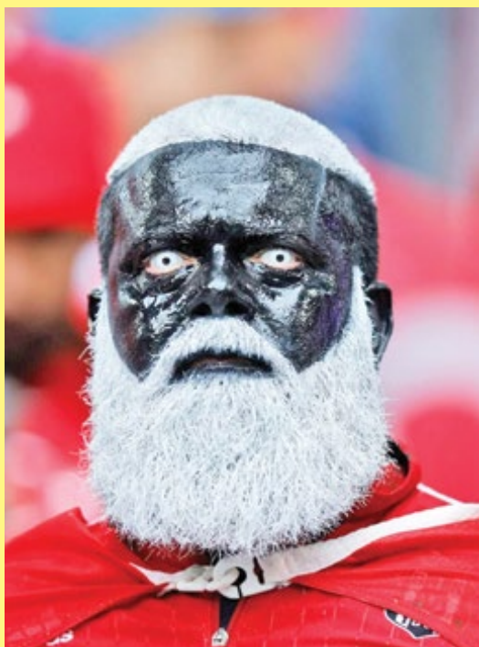
تصویری از هوادار ترکیه‌ای در ورزشگاه با ظاهری جالب و عجیب برای تماشای دیدار ترکیه و گرجستان