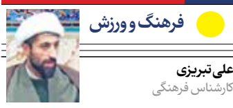
فرهنگ و ورزش