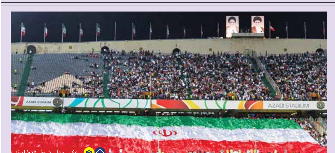
هواداران تیم ملی در بازی ایران برابر ازبکستان، حضور پرشوری در ورزشگاه داشتند و یکصد و به تشویق یوزها پرداختند. هر چند که این دیدار گلی در برداشت و تماشاگران دست خالی آزادی را ترک کردند.