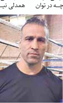
بهبتر نبود تیم ملی قهرمانی از انتخابی المپیک، به جای

چرا تیم ملی بوکس سهمیه المپیک نگرفت؟ مسابقات انتخابی المپیک مثل سال‌های قبل نبود و کار سختی داشتیم. در این دوره فقط نفرات اول و دوم بازی‌های آسیایی و بوکسورهای برتر مسابقات جهانی جواز حضور در المپیک را می‌گرفتند و برخلاف سال‌های قبل مسابقات قاره‌ای برگزار نشد. فدراسیون تمام تلاشش را کرد و از برگزاری اردو و تورنمنت‌های تدارکاتی گرفته تا چیزهای دیگر، هرچه در توان داشت گذاشت اما نمی‌دانم چه اتفاقی افتاد. حس می‌کنم سن ملی‌پوشان ما در قهرمانی گذشته بود چه فدراسیون نایز است. موفقیت بدون پول سخت است و امیدوارم حمایت‌ها از بوکس بیشتر شود.