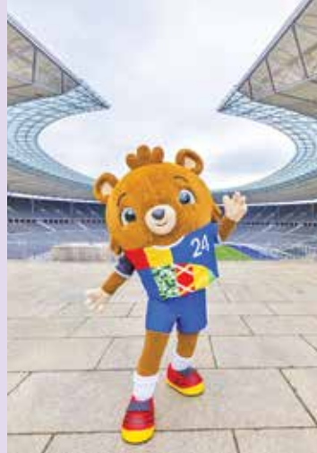
نماد رقابت های یورو ۲۰۲۴ در فاصله سه روز تا آغاز رقابت ها