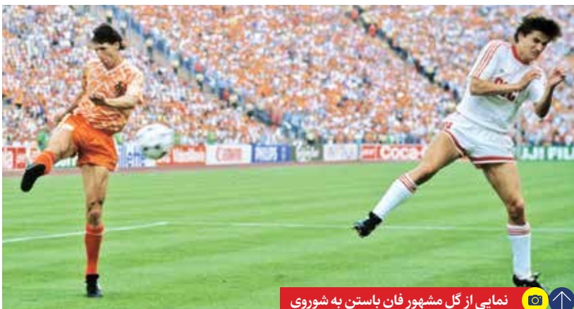
نمایی از گل مشهور فان باستن به شوروی