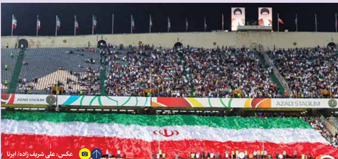
هواداران تیم ملی در بازی ایران برابر ازبکستان، حضور پرشوری در ورزشگاه داشتند و یکصد و به تشویق یوزها پرداختند. هر چند که این دیدار گلی در برداشت و تماشاگران دست خالی آزادی را ترک کردند.