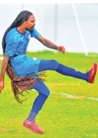
رکورد گینس باید این موها را ثابت کند