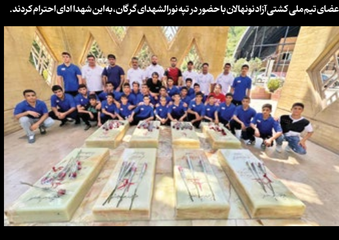
اعضای تیم ملی کشتی آزاد نونهالان با حضور در تپه نورالشهدای گرگان، به این شهدا ادای احترام کردند.