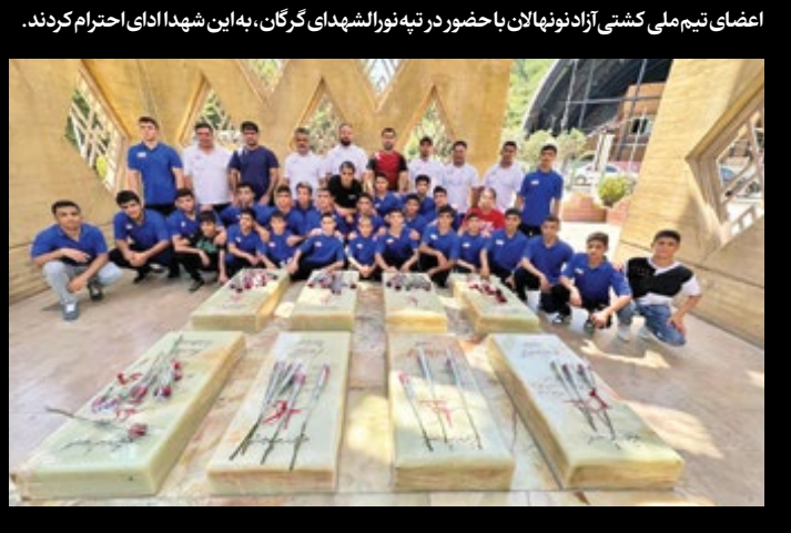
اعضای تیم ملی کشتی آزاد نونهالان با حضور در تپه نورالشهدای گرگان، به این شهدا ادای احترام کردند.