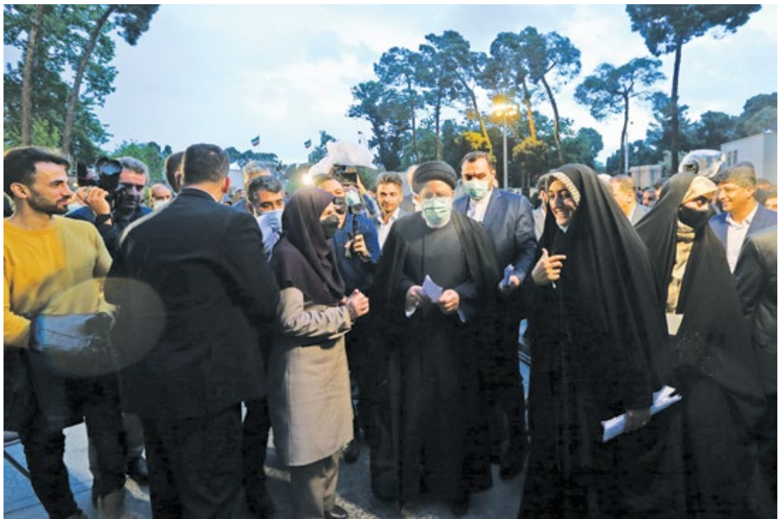
بارش ناگهانی باران پیش از ملاقات با ورزشکاران، سبب شد مراسم در فضای باز نهاد ریاست جمهوری برگزار نشود اما آقای رئیس جمهور تأکید داشت حتماً با قهرمانان ملاقات کند، به همین خاطر جلسات بعدی رئیس جمهور با تأخیر برگزار شد