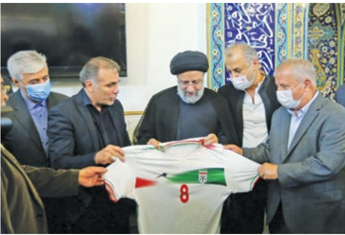
علی پروین به عنوان یکی از چهره‌های سرشناس فوتبال، پیراهن تیم ملی را به شهید آیت‌الله رئیسی اهدا کرد، رئیس جمهوری که همواره حامی فوتبال و ورزش ایران بود

پیش از این معمولاً سیاسیون نزدیک به رئیس جمهور اقبال این امانتداری را داشتند اما آیت‌الله رئیسی در نشست‌های انتخاباتی خود در واکنش به خواسته قهرمانان و اهالی ورزش اعلام کرده بودند که سکان ورزش را به دست اهلس می‌سپارند که این امانت ابتدا