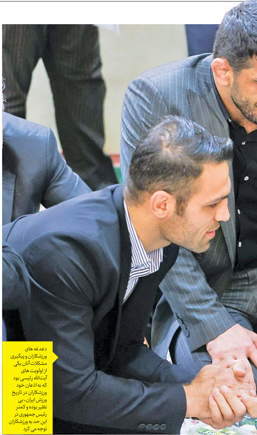
دغدغه های ورزشکاران و پیگیری مشکلات آنان یکی از اولویت های آیت الله رئیسی بود که به اذعان خود ورزشکاران در تاریخ ورزش ایران، بی نظیر بوده و کمتر رئیس جمهوری در این حد به ورزشکاران توجه می کرد

که برای پیگیری اعتبارات حاصل از مصوبات سفرهای استانی، به سازمان برنامه و بودجه کشور زیاد مراجعه می کنم. در همین راستا وقتی با مسئول مصوبات سفرهای استانی صحبت کردم ایشان گفتند که رئیس جمهور دستور ویژه دادند که این مجموعه جدید ورزشی باید به صورت ویژه حمایت شود، همچنین باید به نگاه داشت و بازسازی استادیوم آزادی هم توجه کنیم. اینکه یک دفعه سکوها و چمن ورزشگاه بازسازی و زیباسازی شد به همین پیگیری ها در دولت سیزدهم برمی گردد.