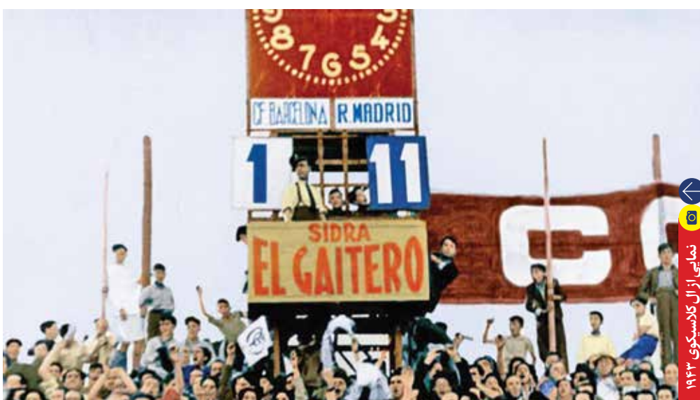
نمایی از آل کلاسیکو ۱۹۴۳

اینجا انتظاری هم نمی‌رود که تیم‌ها به هم تبریک بگویند ولی انتظار هم نیست با اکانت فیک باشگاه‌های دیگر، به هم پز بدهند یا مسائل قومیتی و لهجه را بگیرند