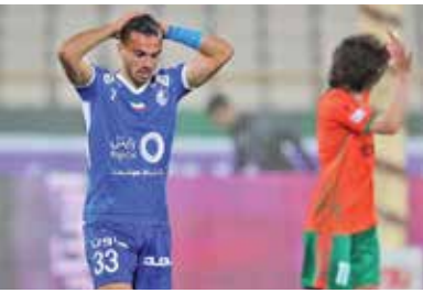
پرس و جو درباره جلالی

باشگاه استقلال سه روز قبل از تقابل با تیم گل گهر سیرجان تلاش فزاینده‌ای برای افزایش تماشاگران در ورزشگاه از خود به خرج داد و تمام رسانه‌های نزدیک به این باشگاه و حتی رسانه‌های مخالف نیز در راستای افزایش تعداد تماشاگران تبلیغات گسترده‌ای انجام دادند تا سکوها پر شود. روز گذشته بیشتر فضایی که قرار است در بازی امروز در اختیار استقلال قرار بگیرد، پر شد تا آبی‌ها به احتمال زیاد با تمام ظرفیت خود مقابل گل گهر قرار بگیرند. استقلالی‌ها معتقدند حضور تماشاگران در بازی امروز موجب افزایش روحیه بازیکنان و کادرفنی برای بازگشت به صدر جدول خواهد شد و با توجه به اینکه پرسپولیس نیز در خارج از خانه مقابل شمس آذر قرار می‌گیرد، احتمال جابه‌جایی دوباره میان صدرنشین‌ها وجود ندارد و استقلالی‌ها نیز درصد استفاده حداکثری از ظرفیت‌های موجود هستند.