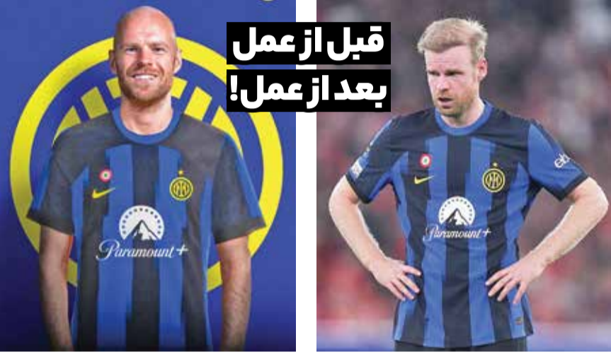
دیوی کلاسن هافبک ۳۰ ساله و هلندی اینتر این روزها با ظاهری متفاوت و جوان تر نسبت به گذشته در میدان فوتبال حاضر می شود. او اخیراً اقدام به کاشت مو کرده است. ظاهر جدید کلاسن مورد توجه کاربران در شبکه های اجتماعی قرار گرفته است.