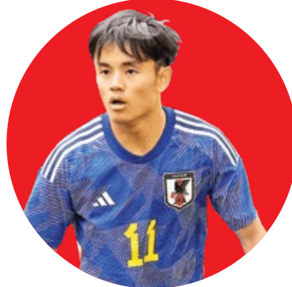
تاکومی مینامینو (مینا)

پرورش یافته آکادمی بارسلونا در لاماسیا، این روزها یکی از بازیکنان مؤثر تیم ملی ژاپن و باشگاه رئال سوسیه داد در لالیگا است. کوبو بعد از درخشش در لاماسیا راهی افسی توکیو شد و سپس به رئال مادرید رفت. او در سال‌های اخیر توسط رئال مادرید به مایورکا، ویارئال، ختافه و رئال سوسیه داد قرض داده شده و در لالیگا پیراهن این تیم‌ها را بر تن کرده است. کوبو طی دو فصل اخیر ۶۹ بازی برای سوسیه داد انجام داده و ۱۵ گل زده. او در ۲۲ سالگی ۳۳ بار در ترکیب ژاپن قرار گرفته و ۴ گل هم وارد دروازه رقیب کرده. ارزش کوبو در بازار ۴۵ میلیون یورو است.