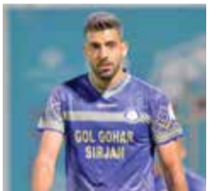
مدافع گل گهر

با توجه به شکایت سیدمهدی رحمتی از باشگاه آلومینیوم اراک، این باشگاه به پرداخت مبلغ ۱۰ میلیارد ریال بابت اصل خواسته و مبلغ ۲۱۸ میلیون ریال بابت هزینه دادرسی در حق خواهان محکوم شد. همچنین کمیته وضعیت نسبت به دعوی خواهان به میزان ۲۶ میلیارد ریال قرار رد صادر کرد. رأی صادره ظرف مدت هفت روز از تاریخ ابلاغ در کمیته استیناف فدراسیون فوتبال قابل تجدیدنظرخواهی خواهد بود.