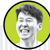
سون هیونگ مین

به گزارش فلوریان پلنتبرگ، منچستر یونایتد قصد داشت برای جذب قرضی تل در نقل و انتقالات زمستانی اقدام کند اما پس از مواجهه با مخالفت این بازیکن ۱۸ ساله، از تصمیم خود منصرف شد. ماتیاس تل با وجود نیمکت‌نشینی در اکثر بازی‌ها، هیچ قصدی برای جدایی از بایرن مونیخ ندارد. الگوپردازی و یادگرفتن مهارت‌های هری کین یکی از دلایلی است که تل می‌خواهد به بازی در جمع باورایی‌ها ادامه دهد.