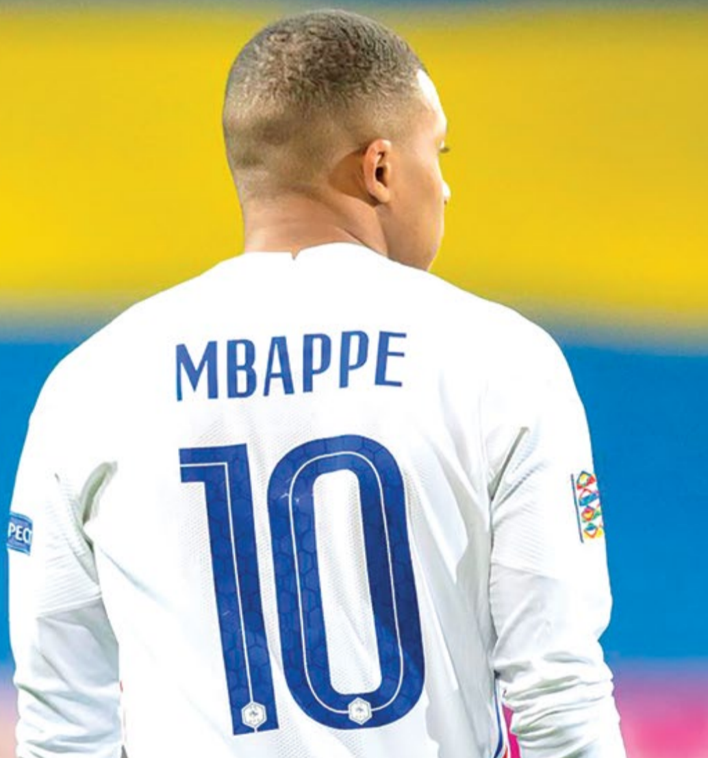
ایمان گودرز روزنامه نگار

روایی امضای قرارداد رئال مادرید با کیلیان امباپه هنوز به پایان نرسیده، اما مهلت‌ها برای بازیکن فرانسوی هر روز کمتر از روز قبل می‌شود و حالا خط قرمز فلورنتینو پرز مشخص شده است؛ ۱۵ ژانویه. در حالی که تنها ۲۵ روز تا آغاز سال ۲۰۲۴ باقی مانده است، ستاره پارسی هنوز قرارداد خود با پاری‌سن‌ژرمن را که به طور رسمی در ۳۰ ژوئن سال آینده به پایان می‌رسد، تمدید نکرده است. تا این لحظه که امباپه قصد تمدید با پاریس را نداشته و در برابر سران قدرتمند قطری این باشگاه مقاومت کرده است، مادرید نه اقدامی انجام داده و نه تا اول ژانویه وارد این پرونده خواهد شد. گفته می‌شود رئال مادرید اقدامات خود را از یک ژانویه برای به خدمت گرفتن کیلیان آغاز خواهد کرد، زیرا از آن تاریخ به بعد دیگر هیچ مشکل قانونی برای مذاکره با بازیکن آزاد که در آخرین سال قراردادش است وجود ندارد و باشگاه پی‌اس‌جی نیز نمی‌تواند در این مذاکرات دخالت کند. چیزی که همیشه مشخص بوده این است که امباپه دیر یا زود به مادرید خواهد رسید اما سرکار گذاشتن رئال مادرید در سال گذشته باعث شد این انتقال حالا با چالش‌هایی روبه‌رو باشد. امباپه تا این لحظه برای جلوگیری از عصبانیت اولتراها تا جایی که شده از علاقه خود به رئال مادرید چشمپوشی کرده و هیچ وقت به صورت علنی در مورد جدایی‌اش از پی‌اس‌جی صحبتی نداشته است. فراموش نکنیم که در ژانویه ۲۰۲۲ همه چیز برای رسمی کردن انتقال کیلیان امباپه به مادرید فراهم بود و خود بازیکن نیز