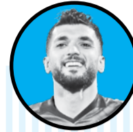
زبیر نیک نفس

آمار جالبی در بازی‌های اخیر از حسینی ثبت شده که نشان می‌دهد به طور یک بازی در میان کلین شیت کرده است. حسینی مقابل هوادار گل خورد اما در بازی با آومینیوم کلین شیت کرد. سپس از شمس آذر گل خورد اما مقابل تراکتور کلین شیت کرد. در نهایت حسینی بار دیگر مقابل ذوب دروازه خود را باز شده دید و حالا طبق این الگوریتم باید مقابل فولاد منتظر گل نخوردنش باشیم!