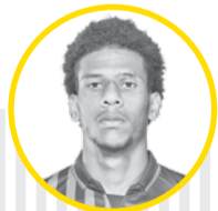
ژان کلو تودیو

در این صورت قرمزپوش خواهد شد به گزارش میرر، منچستر یونایتد در پنجره زمستانی جذب یک مدافع میانی را در اولویت قرار خواهد داد. ژان کلو تودیو، گزینه اصلی شیاطین برای پر کردن حفره خط دفاعی اریک تن‌هاخ است. تودیو با ۴۰ میلیون پوند در دسترس است. در صورتی که فروش ۲۵ درصد از سهام یونایتد به سرجیم رتکلیف نهایی شود، شانس قرمزها برای خرید تودیو بیش از پیش می‌شود چرا که رتکلیف و گروه اینویس مالکیت نیس فرانسه را نیز به عهده دارند.